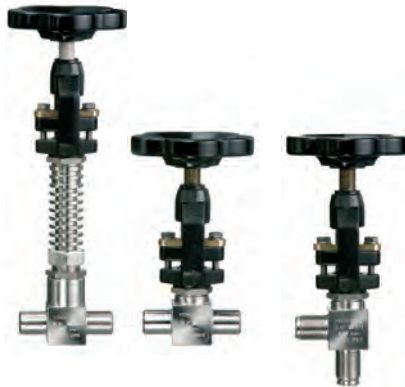
Thiedig Sampling and analysing systems