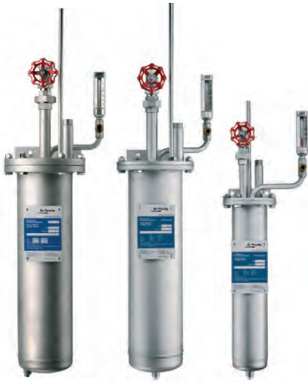
Hochdruckventile | High-pressure valves