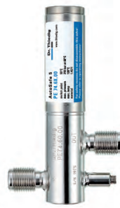
Zubehör | Accessories