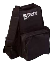
Mallette de transport souple