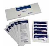
Kit de nettoyage