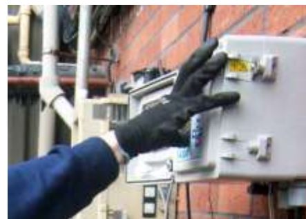
Panneau IP66 offrant une protection contre l'entrée de poussière ou d'eau lors de la programmation